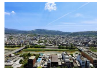
トップラウンジオリゾンテからの 鴨川と東山連峰の景観

※リリースの内容は発表現在のもので、諸般の事情により変更される場合がございます。