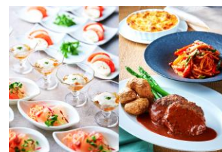
創立祭フェアbuffetイメージ

5月・6月は「創立祭フェアbuffet」を開催。6月7日の株式会社京都ホテルの創立記念日をテーマに、懐かしのホテル洋食を中心にをご用意いたします。前菜には「鯛のカルパッチョ 昆布茶マリネ」や「パリソワール」「カブレレーゼ」、メインディッシュには「シーフードマカロニグラタン」や「スパゲティナーナポリタン」「ハンバーグステーキ デミグラスソース」のほか、シェフが目の前で調理する「牛肉の鉄板焼き」や土・日・祝日には、「ローストビーフ」も登場し、前菜からデザートまで約60種類をご用意します。また、buffetにはフリードリンクが含まれており、7種類のソフトドリンクをお楽しみいただけます。