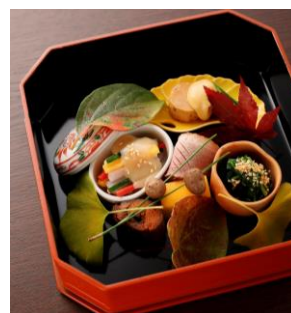
「入舟」料理イメージ

* 4名以上で個室をご利用の場合、個室料無料。集合写真ご優待あり。 * 記載の金額には消費税・サービス料を含みます。