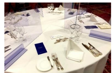
テーブル用アクリルパネル