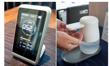
レストラン店内にCO2センサーや 消毒用アルコールを設置