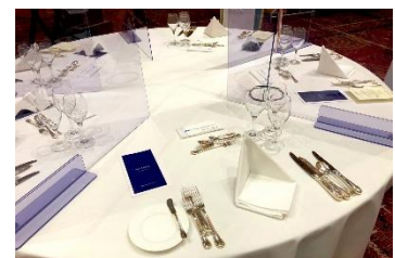
テーブル用アクリルパネル

※2) 宴会場における新型コロナウイルス感染防止に関するガイドライン全文はホテル公式サイトに掲載しております。