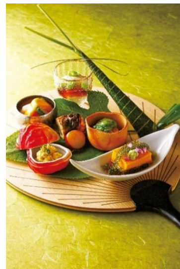
京料理「入舟」料理イメージ