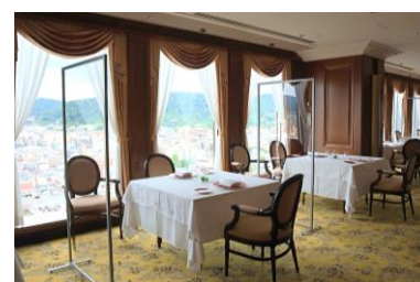
仕切りを設置した「ピトレスク」店内

※2) レストランにおける新型コロナウイルス感染防止に関するガイドライン全文はホテル公式サイトに掲載しております。