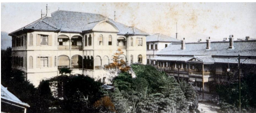
創業期の京都ホテル

株式会社京都ホテルは明治21年、1888年に創業。創業の2年後には、現在の「京都ホテルオークラ」が立つ場所に京都では最初期となる洋館3階建ての本格的な洋式ホテルを開業しており、「青淵先生六十年史 第二巻」（明治33年編纂）に、その頃渋沢栄一から扶助を受けたという記述が残っています。