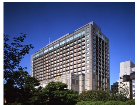
現在の京都ホテルオークラ (2002年に京都ホテルから改称)

*リリースの内容は発表現在のもので、諸般の事情により変更される場合がございます。