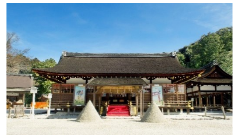
賀茂別雷神社(上賀茂神社)

「呑湖閣」など通常非公開の境内を住職にご案内いただき、呈茶をお楽しみいただきます。