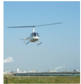
ヘリコプター遊覧飛行イメージ

※ホテル～ヘリポート間の送迎はプラン内に含まれております。 ※ヘリコプター遊覧は、気象条件などによって運行中止となる場合がございます。