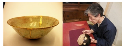
「漆芸舎 平安堂」の金継ぎイメージ