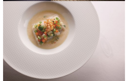
[上] スイートルームイメージ