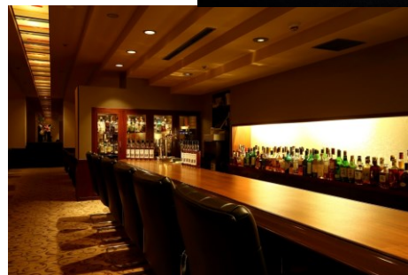
[上] カクテルイメージ