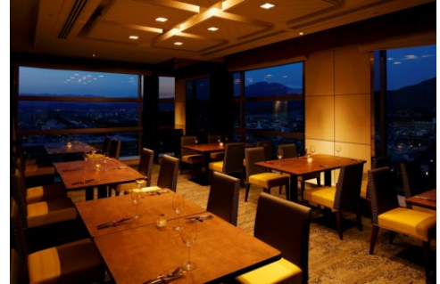
「オリゾンテ」店内イメージ

【日時】2017年2月24日(金) 17:00~18:45 (L.O. 18:30、要予約)