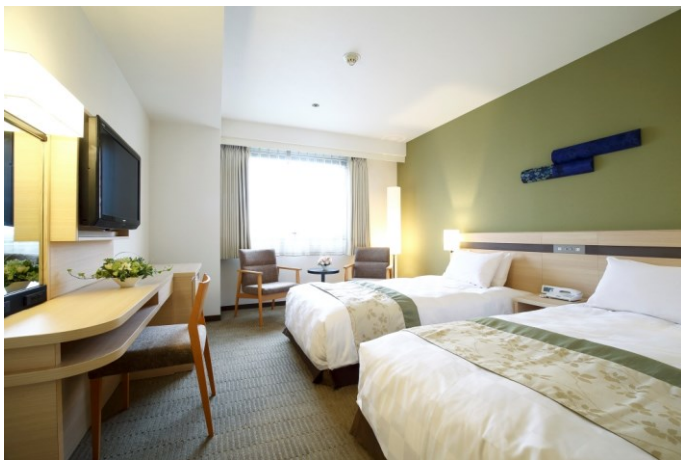
「スーパーアツインルーム」(10,11階)一例 「凜(りん)」をコンセプトとした爽やかなグリーン色の壁に和柄の飾りを配した。